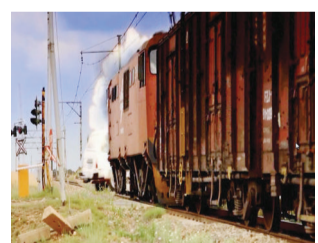
Transnet voer 'n veldtog teen mense wat spooroorgange ignoreer.